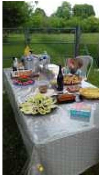
Une table appétissante disponibles le seront et que notre joie partagée en décidera d'autres.

Sur la bande de terrain herbée que nous avons la chance d'avoir au cœur de l'étoile de nos rues, nous avons pris l'apéro autour d'une table bien garnie. Tout est délicieux. Une belle manière de se découvrir ou de faire plus ample connaissance, même si certaines familles se connaissent déjà un peu grâce à l'école de leurs enfants. Et avec eux nous avons aussi joué au ballon et au mikado et memory géants empruntés à la ludothèque.